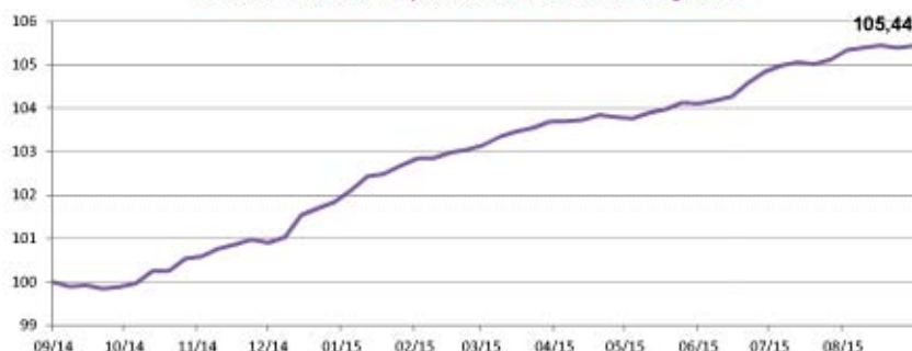
Évolution de la Valeur Liquidative en base 100 sur 1 an glissant

Document réservé aux actionnaires de PRIMONIAL CAPIMMO - ne pas diffuser